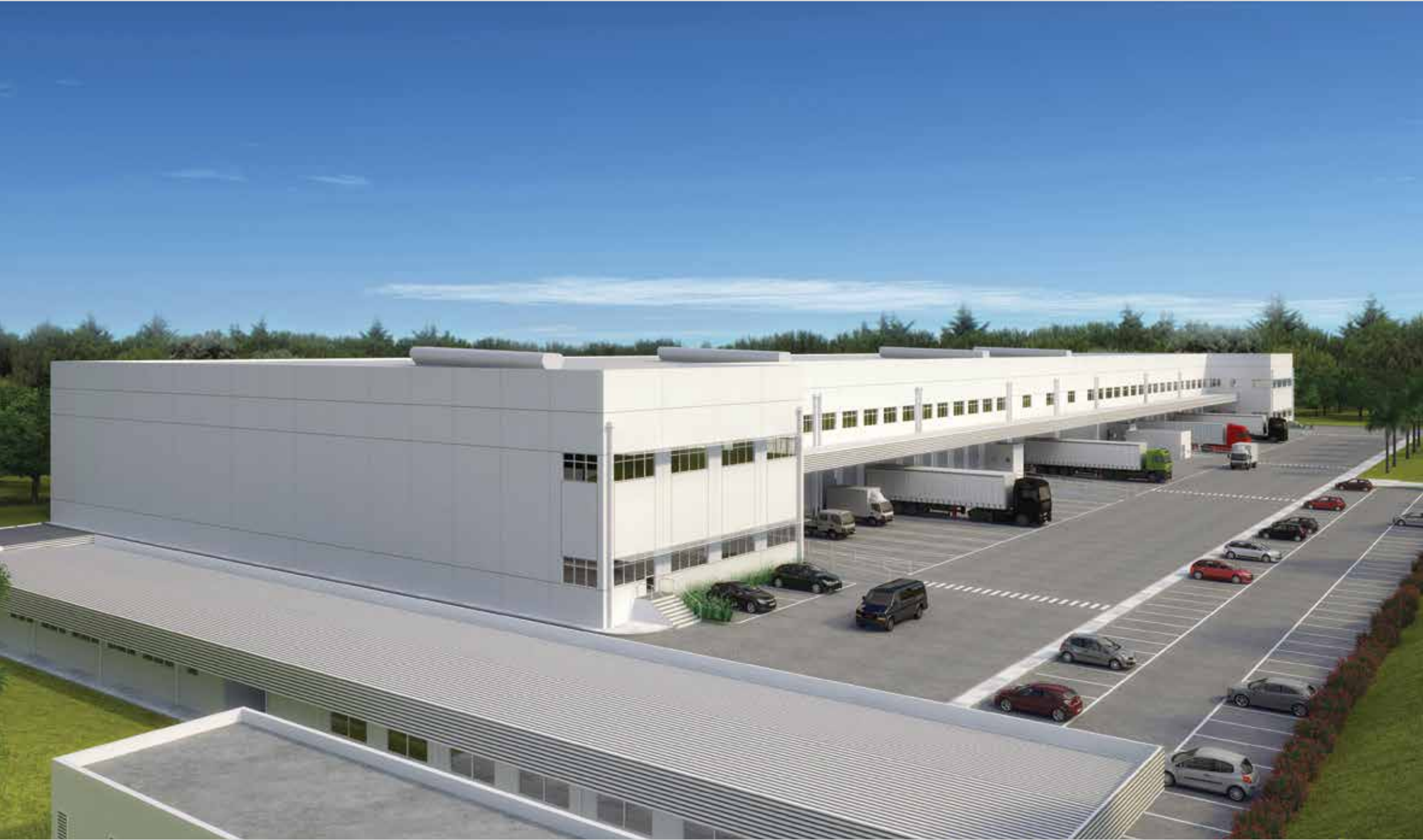
Perspectiva ilustrativa do empreendimento.