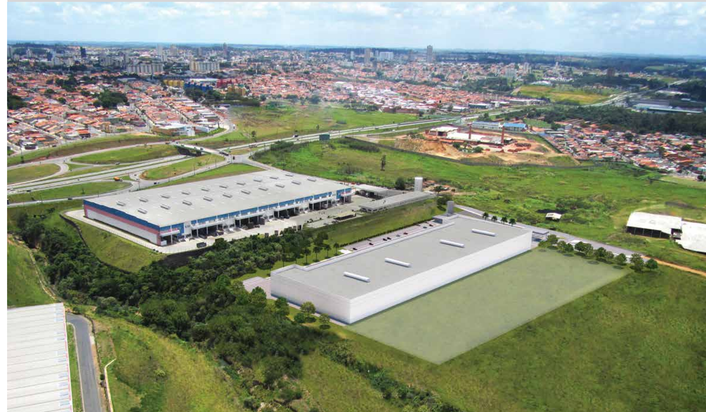
Vista aérea do local.

O MULTI MODAL OFERECE TUDO PARA GARANTIR O CONFORTO E A TRANQUILIDADE QUE SEU NEGÓCIO PRECISA.